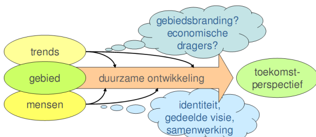
Fig. 3: Geen haalbaar economisch perspectief zonder keuzen in de waardenoriëntatie

De expert meeting levert een aantal heldere bevindingen op. Er zijn zeker kansen, maar de onderlinge samenhang ontbreekt. Visierapporten en projectplannen buitelen al enkele jaren over elkaar heen. Diverse partijen zijn voor verschillende opdrachtgevers bezig met toekomstplannen. Niet alleen voor de Biesbosch maar ook voor o.a. de vestingsdriehoek, de Nieuwe Hollandse Waterlinie en voor recreatiemogelijkheden langs de rivierdijken (project Dijk van een Delta) worden plannen ontwikkeld, evenals een toeristisch-recreatieve visie voor de gemeenten. De regiopartijen zijn er bij betrokken, maar het lijkt hen meer te overkomen dan dat zij zelf aan het stuur zitten. Daardoor blijft men achter de ontwikkelingen aan lopen. Tijdens de bijeenkomst komen geen ernstige knelpunten of urgente toekomstige opgaven voor het gebied naar voren. Waarom dan toch een verkenning naar (andere) economische dragers? Wat gaat er mis als er niets nieuws in gang gezet wordt? Het is niet duidelijk waar de regio heen wil of wat ze wil bereiken. Mogelijk kiest men impliciet voor het behoud van het bestaande. Dat kan heel legitiem zijn, maar alleen expliciete keuzen bieden duidelijkheid. Dat is niet eenvoudig: het vraagt om alternatieven met inzicht in consequenties, en criteria voor een goed afwegingsproces. Verderop geven we hiervoor handvatten. Pas na het maken van keuzen is het zinvol een strategie uit te werken.