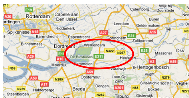
Fig. 1: Biesbosch en Land van Heusden en Altena: ligging tussen stedelijke gebieden

“Volgens vele visies en rapporten kan er van alles in het gebied. Maar ik zie alleen een grote lege ruimte. Er gebeurt dus eigenlijk niets! Is dat zo erg?” Die vraag kwam helder naar voren bij de start van de expert meeting over de toekomst van Biesbosch en het Land van Heusden en Altena. De bijeenkomst werd georganiseerd op verzoek van de Gebiedscommissie Wijde Biesbosch. Hierin werken verschillende organisaties samen aan de verbetering van de economische en sociale vitaliteit en de kwaliteit van de leefomgeving. De vraag aan de experts was of de vrijetijdsector ontwikkelingskansen biedt voor de regio en hoe die dan te benutten. En: welke andere kansen zijn er?