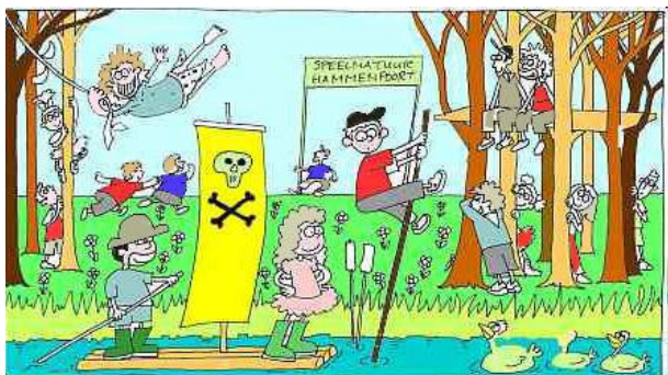
Fig. 4: Nieuwe kansen in een waterrijk gebied

Voor leisure of toerisme en recreatie zijn er kansen gezien de aantrekkelijke aspecten natuur, rust, ruimte, diversiteit, authenticiteit. Maar het gebied kent ook grote belemmeringen: het ontbreken van voldoende verblijfsmogelijkheden en een kwalitatief goed recreatief aanbod, een niet op hospitality gerichte gebiedscultuur en vooral: de wens tot behoud van de (ook zondags-) rust in het gebied. De eerste belemmeringen zijn overkomelijk, de cultuurgerelateerde aspecten zijn moeilijk of niet te veranderen.